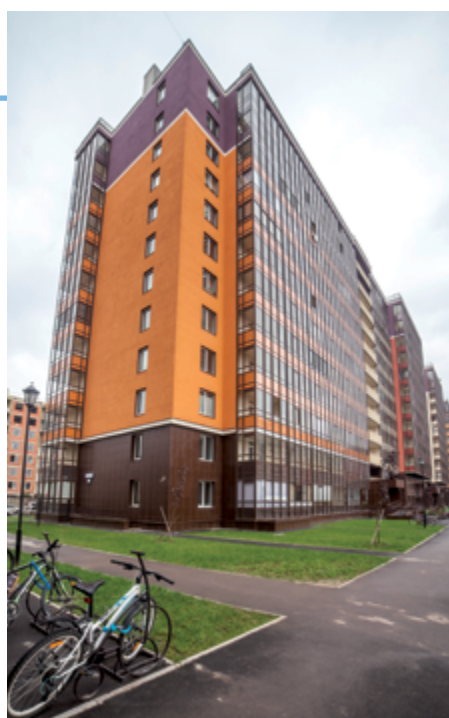
ЖК «Солнечный город-4»