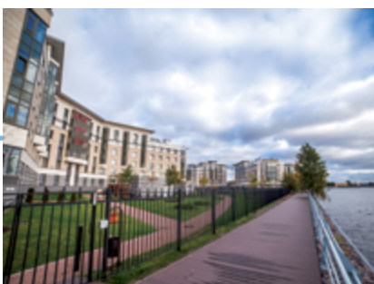
ЖК «Royal Park»