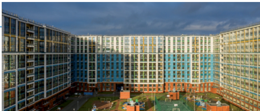
ЖК «Облака на Лесной»

Перед передачей ключей собственникам все помещения проходят комплексную проверку технической службы управляющей компании: готовность объекта согласно проекту застройщика, общестроительные работы, инженерные системы.