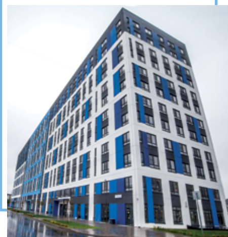
ЖК «Высший Пилотаж»