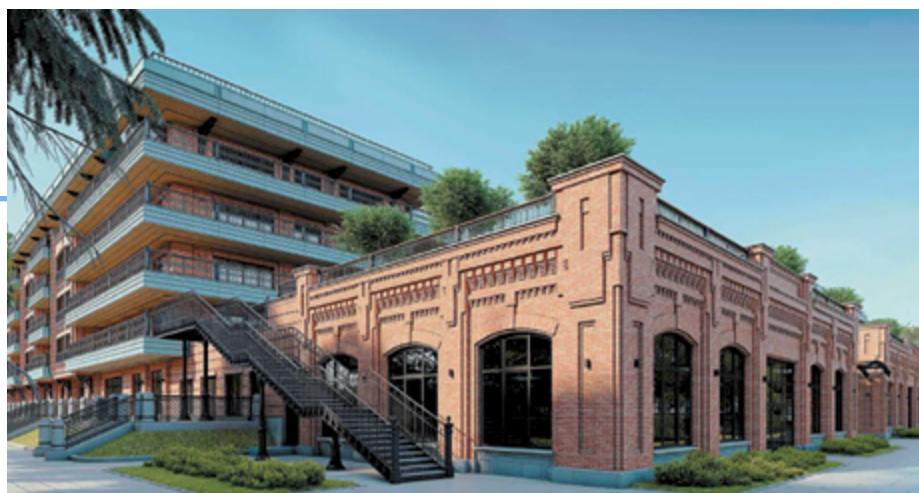
Комплекс резиденций «Императорский Яхть-Клуб»

» «КОСМОСЕРВИС» С ГОТОВНОСТЬЮ ПОДДЕРЖИВАЕТ НОВОСЁЛОВ НА НОВОМ ЖИЗНЕННОМ ЭТАПЕ: СЛАЖЕННАЯ И ПРОФЕССИОНАЛЬНАЯ КОМАНДА УЖЕ НА ПРОТЯЖЕНИИ 20 ЛЕТ ОСУЩЕСТВЛЯЕТ УПРАВЛЕНИЕ МНОГOKВАРТИРНЫМИ ДОМАМИ. МЫ УВЕРЕНЫ, НАШИ ЗНАНИЯ, ОПЫТ И ОТВЕТСТВЕННОЕ ОТНОШЕНИЕ К ДЕЛУ ПРИНЕСУТ ПОЛЬЗУ И БУДУТ СПОСОБСТВОВАТЬ УСТАНОВЛЕНИЮ ДОБРОСОСЕДСКИХ ОТНОШЕНИЙ