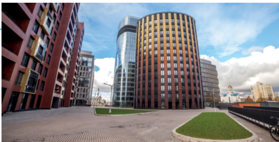
ЖК «Новый Город»

COSMOSERVICE УПРАВЛЕНИЕ ЖИЛИЩНО-ДОМОВОЙ ОБЛАСТЬЮ